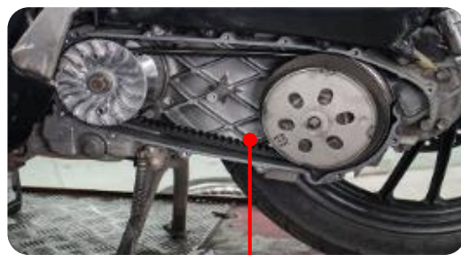
TRUYỀN ĐỘNG CUROA XE TAY GA