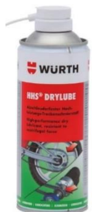
BẢO DƯỠNG BÔI TRƠN DÂY SÊN (MỠ BÒ KHÔ)