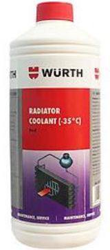
NƯỚC GIẢI NHIỆT