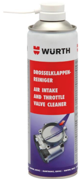
VỆ SINH HỌNG GA